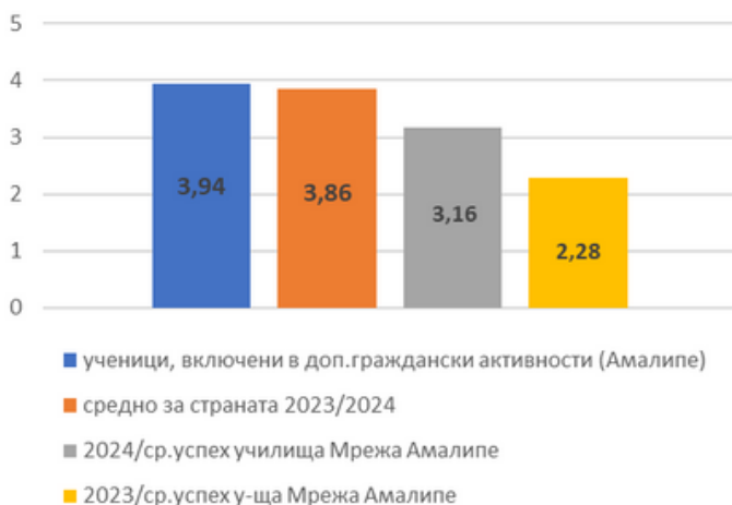
Резултати на ДЗИ-БЕЛ